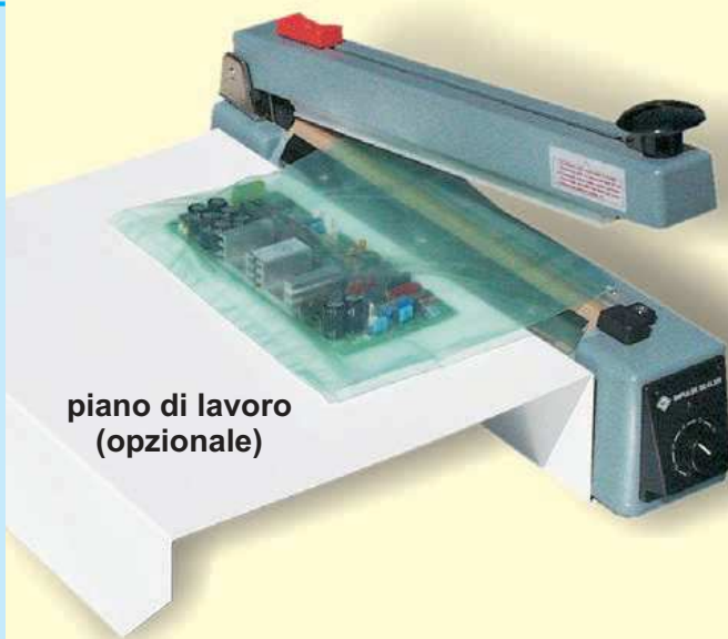
piano di lavoro (opzionale)